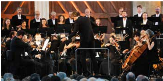
Les Métaboles et l'Orchestre national de Metz Grand Est