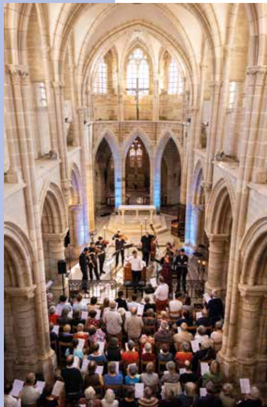
Ensemble Masques

Vivez un moment musical unique avec Olivier Fortin et l'ensemble Masques autour de Jean-Sébastien Bach ! Cette année, les musiciens vous proposent l'interprétation de deux cantates et vous invitent à participer en chantant avec eux les deux chorals conclusifs.