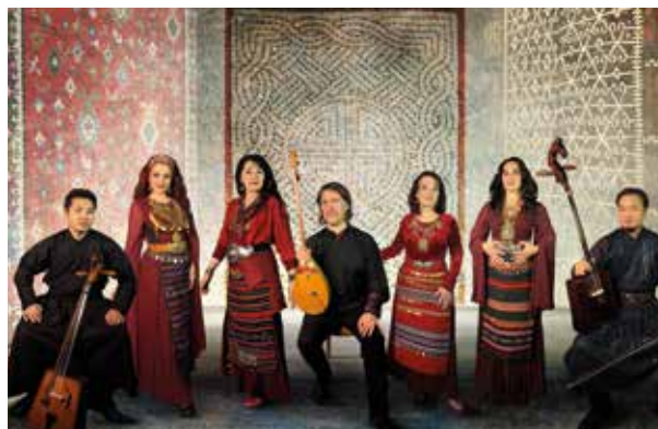
Quatuor Balkanes & Trio Diphonique

18h VÉZELAY, TERRASSE DE LA BASILIQUE Accès libre