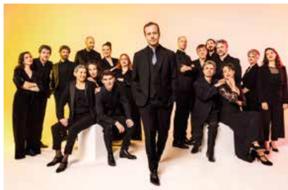
Aedes