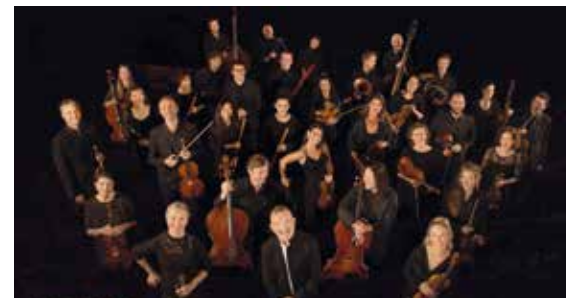
Les Talens Lyriques