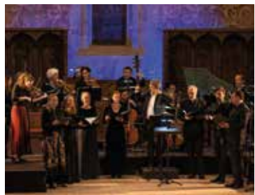
Gli Angeli Genève

Joseph HAYDN (1732-1809), Kleine Orgelmesse en si b majeur Hob. XXI:7, Salve Regina en sol mineur Hob. XXIIIb :2