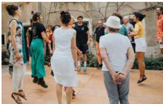
Atelier danse

17h • JEU. 20 AOÛT VÉZELAY, PORTE DU BARLE > TERRASSE Gratuit