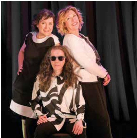
Gospel Fire Trio