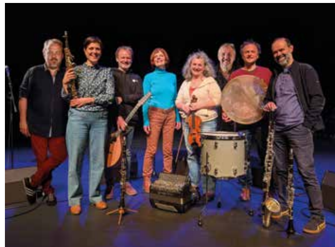
Tribu Zinzolin