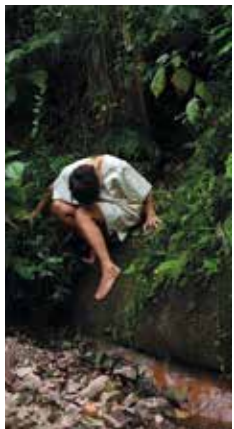
Madre Selva