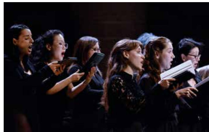
Coro Ghislieri

CORO E ORCHESTRA GHISLIERI Giulio Prandi direction