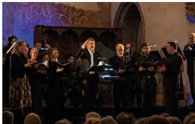
Gli Angeli Genève

16h VÉZELAY, BASILIQUE SAINTE-MARIE-MADELEINE Tarifs : 8 € à 43 € Détail p.36