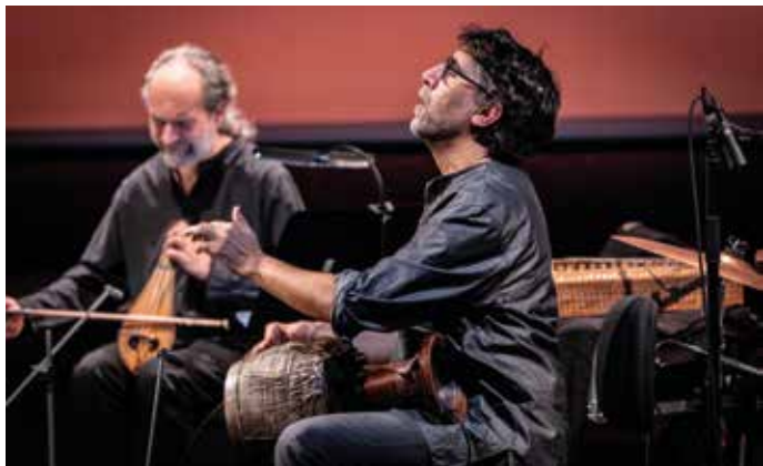
The Modal Experience © Giulia Charbit