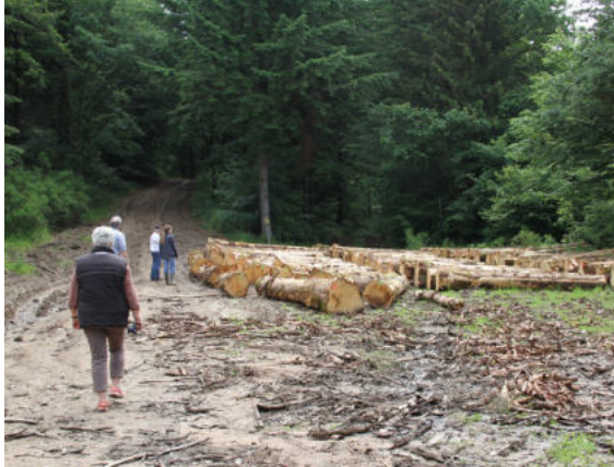
Etat des lieux d'un chemin à la fin d'un chantier de débardage dans le Morvan

Le parc du Morvan conduit une expérimentation avec quelques communes forestières pour parvenir à une meilleure protection des chemins, en évitant de faire subir le cycle dégradation / remise en état pour les chemins patrimoniaux. Il s'agit d'identifier les chemins les plus précieux puis de mettre en place les mesures qui empêcheront toute dégradation 25 .