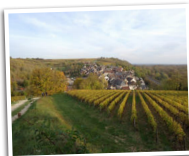
Chemin dans les vignes, Pouilly-sur-Loire

L'évolution de l'agriculture tend à l'élargissement des chemins et à l'arasement des haies et talus