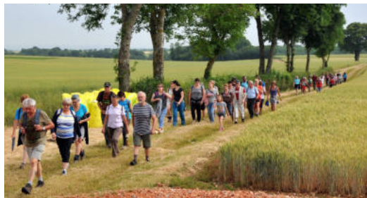
Les chemins ruraux sont indispensables à la randonnée sous toutes ses formes

La meilleure garantie de protection des chemins ruraux est leur utilisation par les publics les plus divers. La commune peut favoriser la création d'itinéraires de randonnée, qu'ils soient balisés ou non, de chemins vers l'école... Elle peut créer une commission municipale des chemins pour traiter ces différents sujets et organiser un dialogue régulier avec les riverains et les usagers, par exemple les associations. Les dynamiques autour des chemins au sein des communes peuvent également amener à l'organisation de chantiers participatifs pour les chemins nécessitant de gros travaux (ré-ouverture d'un chemin délaissé par exemple).