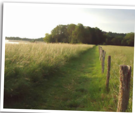
Chemin de bord de Loire, à Gimouille

Sentier du Passeur, espace naturel sensible