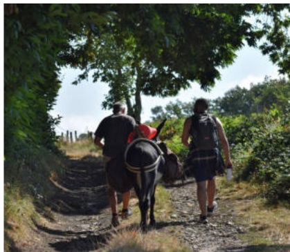
Le chemin est un support d'activités économiques autour des randonnées

Les chemins ruraux sont des voies de communication, ils jouent aussi bien d'autres rôles.