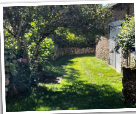
Chemin de hameau, Les Marceaux à Villapourçon