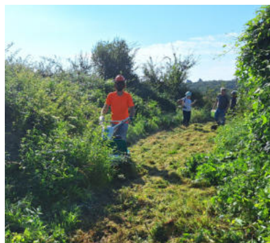
Entretien par des bénévoles

L'entretien de la végétation incombe à la commune pour ce qui concerne l'emprise au sol du chemin et aux riverains pour les haies ou les arbres de leur propriété qui tomberaient sur le chemin.