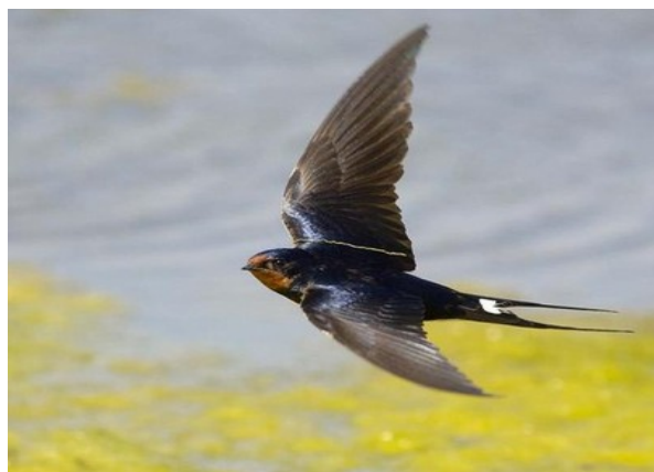
Je suis ...