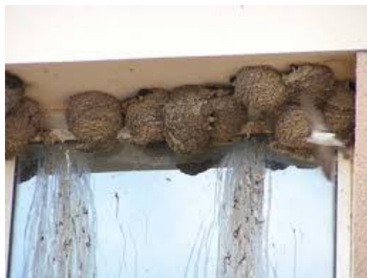
Je suis ...