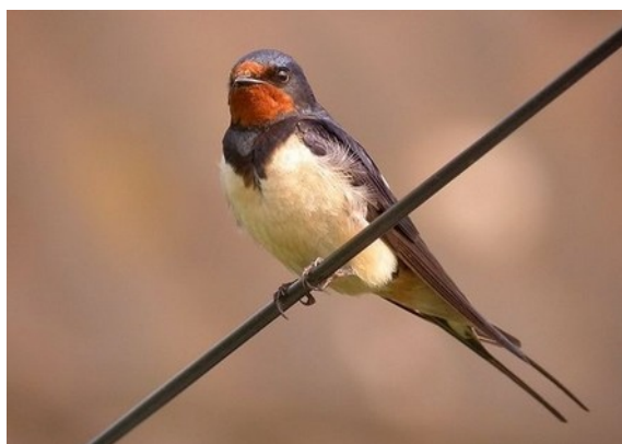
Je suis ...