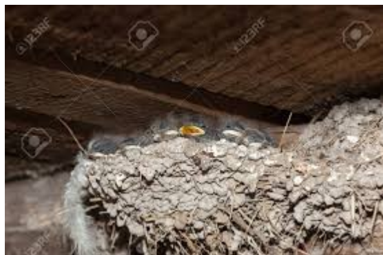
Je suis ...