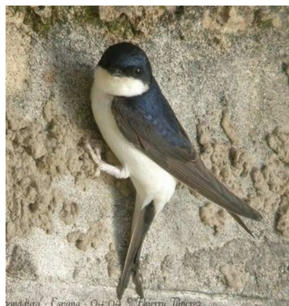
Je suis ...