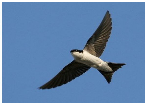
Je suis ...

Pour participer à l'enquête sur les hirondelles et martinets c'est ici :