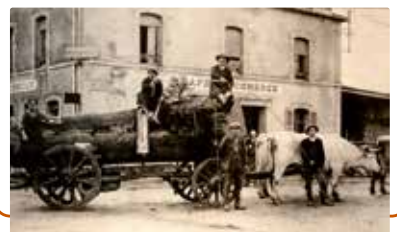
Galvachers au travail

Autour des objets, des portraits et des paroles de galvachers, on y évoque la vie rurale en Morvan, les rapports de l'homme à l'animal, le début de l'exode rural, mais aussi les temps de fête qui marquaient le départ et le retour de ces charretiers et qui rythmaient la vie de nombreux villages du Morvan central et du Haut-Morvan.